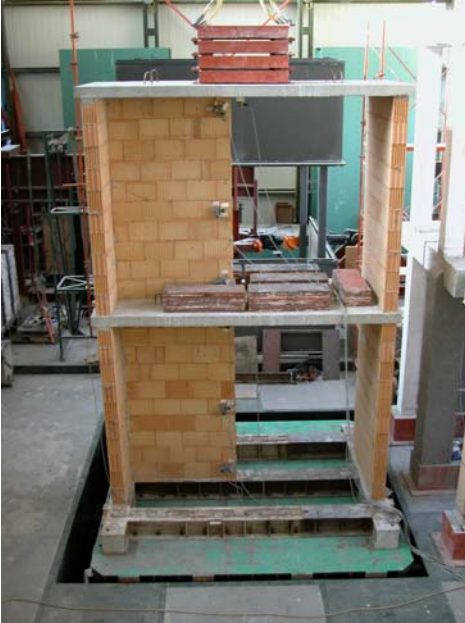
Bild 1: Prüfkörper aus Plan-HLZ für die Rütteltischversuche in [1]

Die Versuche sind umfassend in [1] dokumentiert. Bild 1 zeigt einen zweigeschossigen Prüfkörper mit einer Schubwand aus Planziegeln.